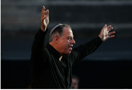
Daniel Oren

Dirijorul israelian Daniel Oren m-a surprins mai mult neplăcut, față de vasta sa experiență și, nu în ultimul rând, față de solida sa reputație. La pupitrul Orchestrei și Corului Areei din Verona, a condus cvasi-licențios cu accelerandouri distructive de echilibru în scenele de ansamblu din actele I și II, cu tempi prea rapizi în tabloul triumfal ce l-au privat de măreția scriiturii și cu variații agogice nejustificate dramaturgic în duetul Amneris-Radamès. Sigur pe baghetă, Oren a urmărit bine platoul iar instrumentiștii și coriștii au răspuns calitativ la impulsurile sale deși, conceptual, acestea nu au ținut cont de rigoarea verdiană.