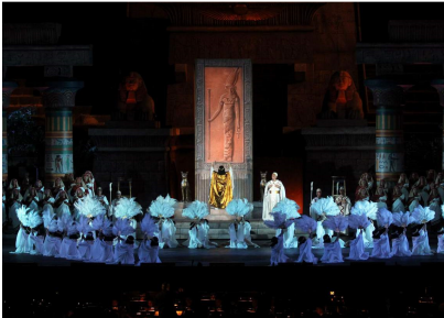
Scenă din actul I

final. La pasiv, aș nota un vibrato mai accentuat pe unele note centrale și, dată fiind dorința de a epata, emiterea cu avânt sporit a unor sunuri înalte, cu rezultantă în situarea peste tonul corect. În aceeași direcție, De León fragmentează chiar fraza muzicală pentru obținerea unor efecte mai prelungi, spectaculoase, cum ar fi în ultima replică a actului al III-lea, „Io resto a te”.